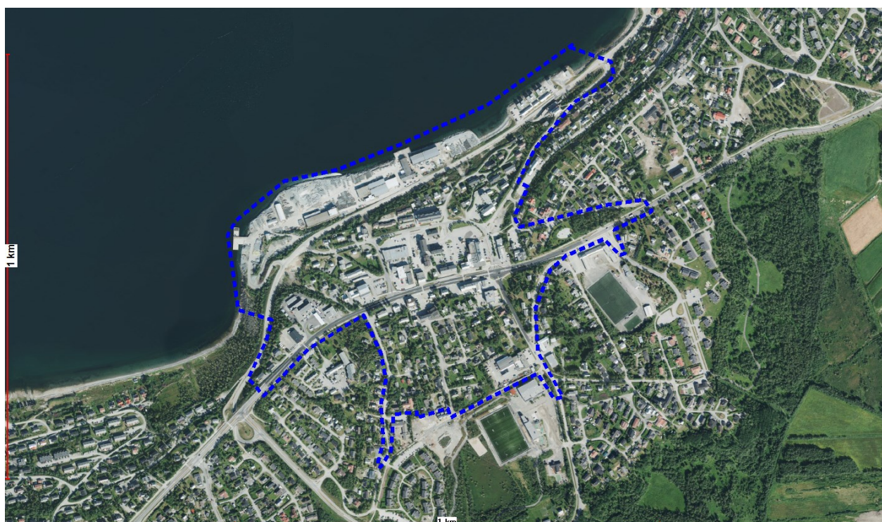
Kartutsnitt som viser avgrensningen av planområdet.

Det har over mange år vært et sterkt ønske om å få laget en ny sentrumsplan for Bossekop. Kommunestyret vedtok i februar 2014 at Alta kommune skulle igangsette utarbeidelse av en områdeplan som grunnlag for fremtidig utvikling av området. Planoppstart ble varslet og planprogram for arbeidet vedtatt samme år. Det ble samtidig opprettet en arbeidsgruppe bestående av representanter fra Alta kommune, Statens vegvesen, næringslivet og beboerne i Bossekop.