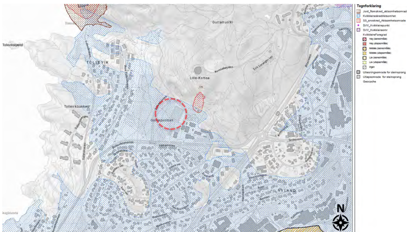
> Figur 5: Utsnitt fra NVE atlas som viser aksjonsområde for skred og flom- Tiltaksområdet er markert i rødt

Iht. TEK17 § 7-1(1) skal byggverk plasseres, prosjekteres og utføres slik at det oppnås tilfredsstillende sikkerhet mot skade eller vesentlig ulempe fra naturpåkjenninger (flom og skred). Et utsnitt fra NVEs karttjeneste www.atlas.nve.no er vist i Figur 5.