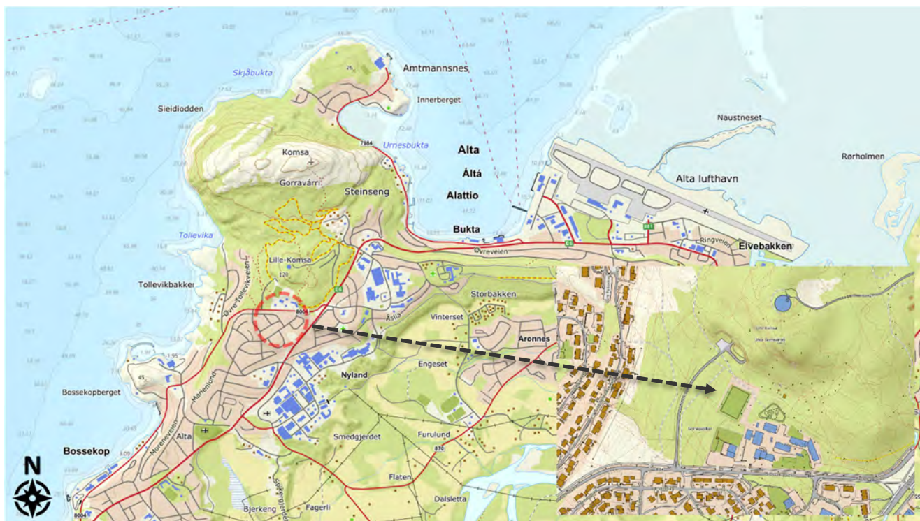
> Figur 1: Tiltaksområdets plassering vist i rødt, www.norgeskart.no

Det skal oppføres ny Komsa skole i Alta, eiendommen gnr./bnr. 29/184 i Alta kommune. Den nye skolen oppføres ved siden av dagens skole, slik at driften av skolen kan opprettholdes i anleggsperioden. Tiltaksområdets plassering er vist i Figur 1. Dr.techn. Olav Olsen AS (OO) er engasjert for å utføre en geoteknisk vurdering for det planlagte tiltaket. Foreliggende notat omhandler geotekniske forhold som er relevante for byggesaken.