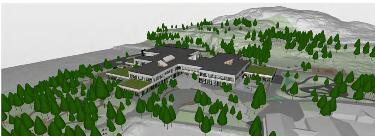
> Figur 2: Utsnitt fra prosjektets IFC-modell

Et utsnitt fra prosjektet sin IFC-modell for skolebygget er vist i Feil! Fant ikke referanseilden.. Ny skole ligger på dagens baneanlegg like nordvest for dagens skoleområde. Bygget skal ha 1 – 2 etasjer over ei plate på mark.