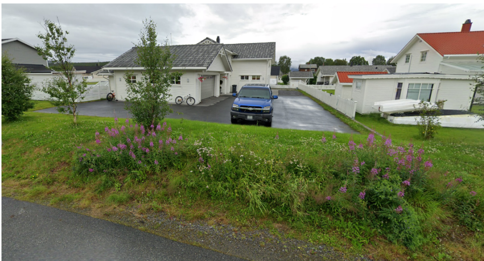
Kartutsnitt 3: Bildet er hentet fra Google maps og viser omsøkt areal fra juli 2022. På bildet ser man adkomsten på den andre siden slik den er regulert inn i dag. Omsøkt endring omhandler en adkomst via grønnstrukturen.

Omsøkt endring berører et areal som er avsatt som klimavernsone. Formålet med klimavernsonen er å hindre inngrep og endringer i eksisterende terreng og vegetasjon som fører til uheldige endringer i lokalklimatiske forhold. I reguleringsplanen for Pato Outa er det regulert klimavernsone med intensjon om at vegetasjonen blant annet skal vernes og bevares. I denne saken kan en si at det blir en avveining mellom interessene for naturvern og trafiksikkerhet, da den omsøkte endringen bidrar til å forbedre trafiksikkerheten i området, men nedbygger deler av areal avsatt til klimavernsone. For omsøkt areal er terrenget som er avsatt til klimavernsone et terreng som består hovedsakelig av gress.