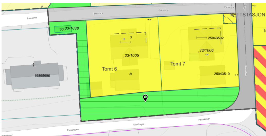
Kartutsnitt 2: Bildet viser omsøkt areal markert med markør.