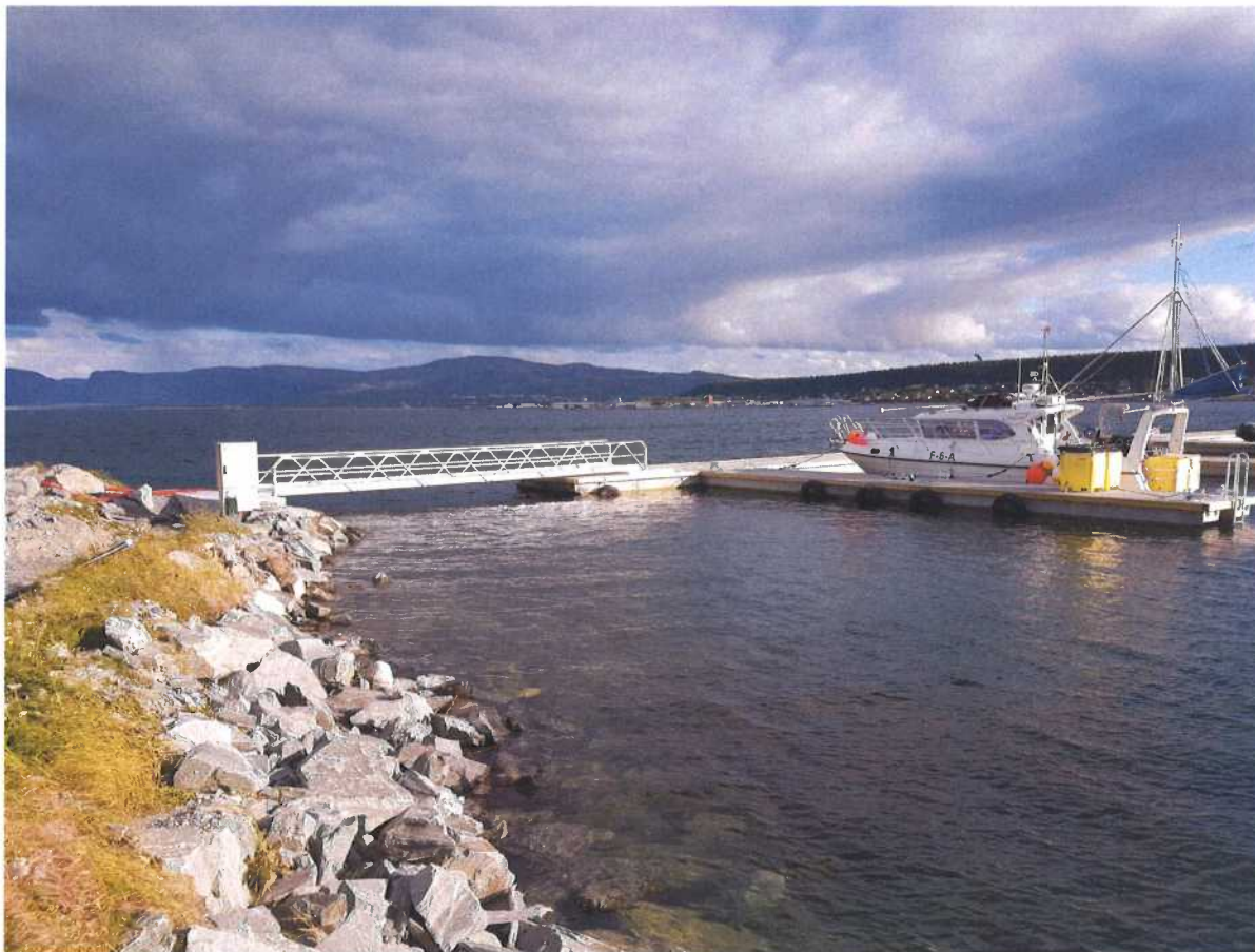
Figur 1. Urnesbukta