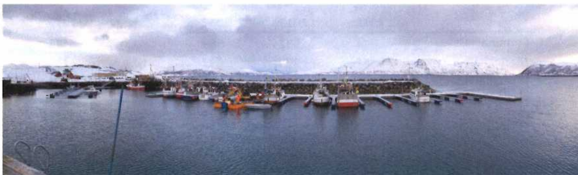
Figur 1. Ny marina på Storekorsnes